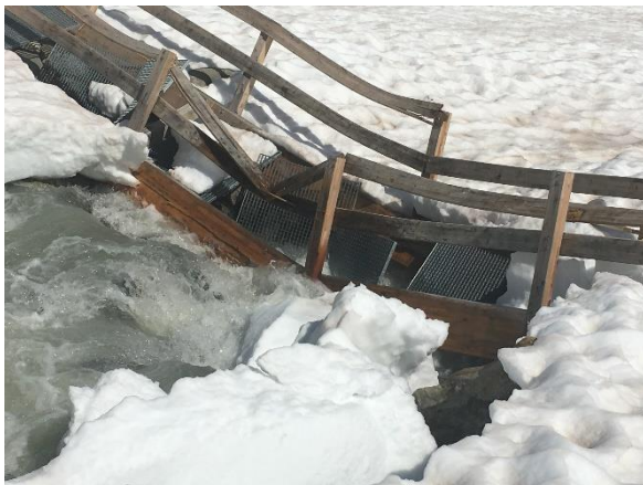
Zerstörte Brücken aufräumen