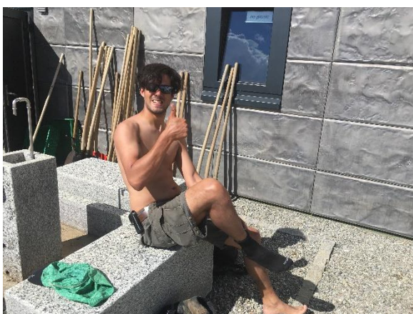
Harter Tageseinsatz abgeschlossen