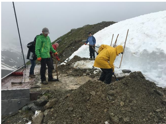
Vorbereiten bei Regenwetter am Vormittag