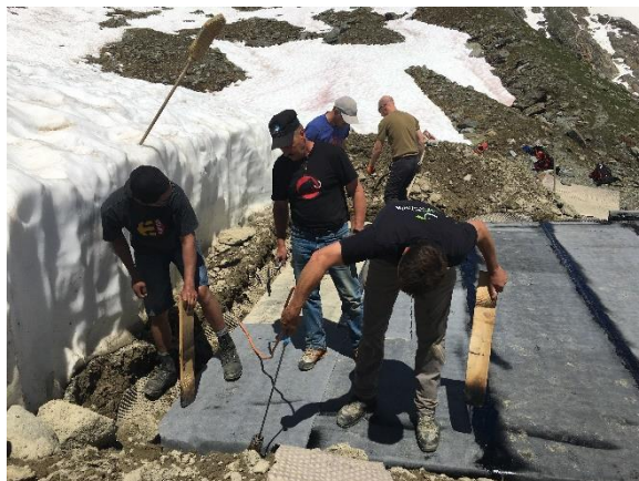
Neues Flachdach bei Sonnenschein am Nachmittag