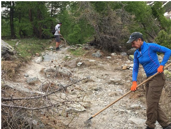
Wanderwege säubern und präparieren