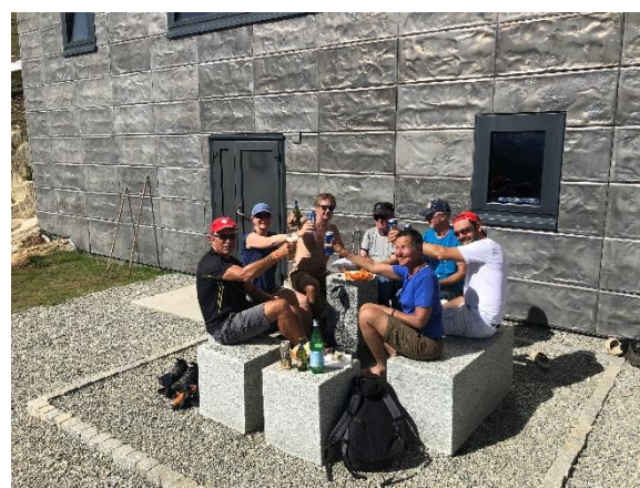
Füsse baden und Apéro 1 genießen