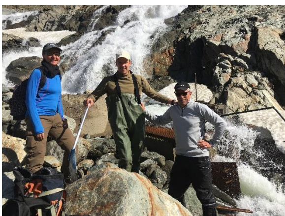
Spülung der Wasserfassung des Kraftwerkes