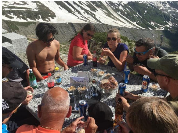
Tagesabschluss mit Feierabendbier