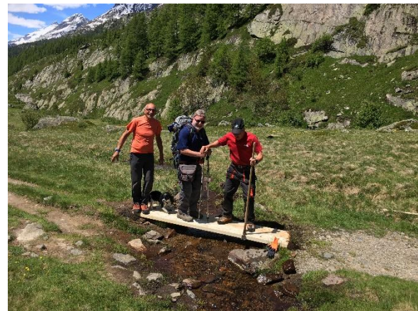
Neue Stege über kleine Bäche setzen