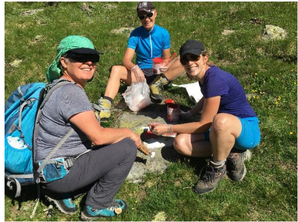
Markieren der Wanderwege