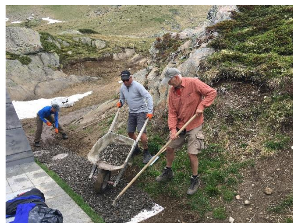
Neue Drainageleitungen bei der Hütte