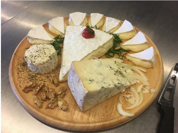
Das Hüttenteam belohnt die Anpacker