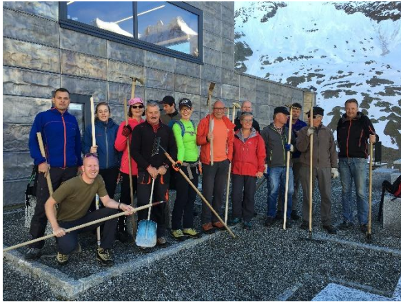
Motiviertes Anpackerteam vor Arbeitsbeginn